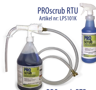
PROscrub RTU Artikel nr: LPS101K