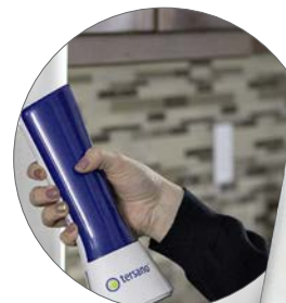
iClean mini Artikel nr: LQFC220