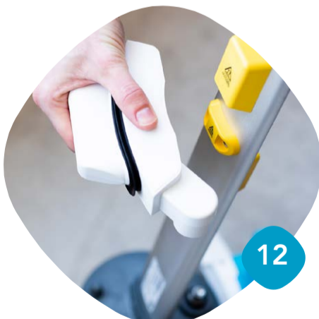
Ta loss utloppet & skölj