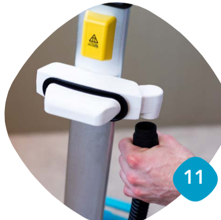
Ta loss sugslangen