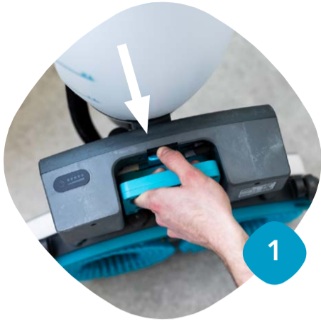
Klicka loss batteriet

Så här enkelt rengör du din maskin för bästa städresultat.