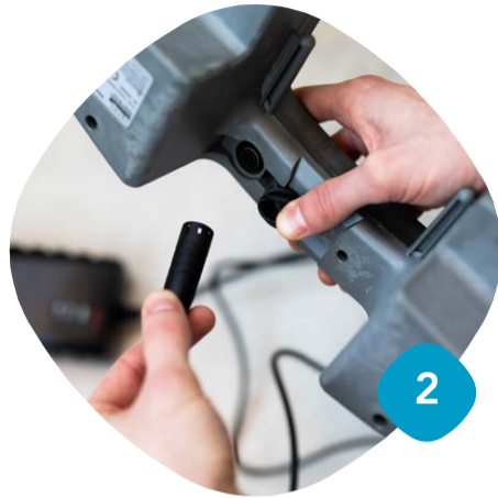
Sätt på laddning