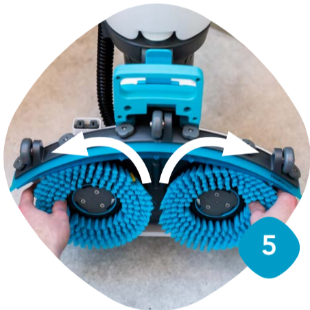
Ta loss borstarna & rengör