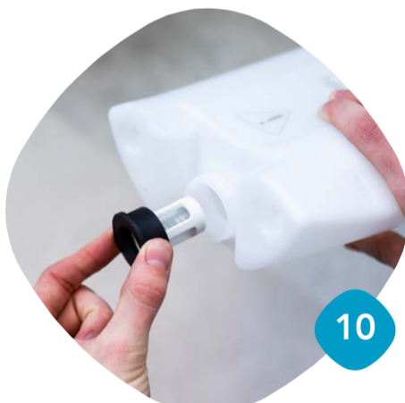
Ta ur silen & rengör