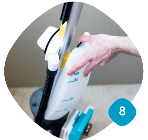
Ta loss renvattentanken