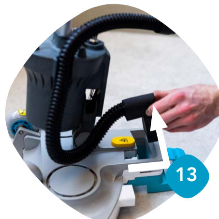
Ta bort sugslangen & skölj