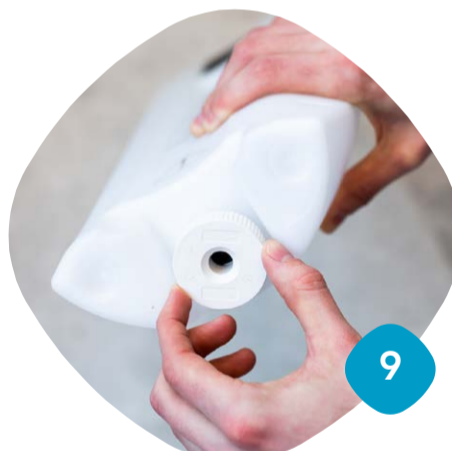
Gänga loss locket