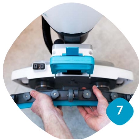
Ta loss sugskrapan & rengör