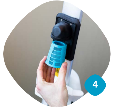
Ta ut filtret & rengör