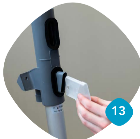
Ta loss utloppet & rengör