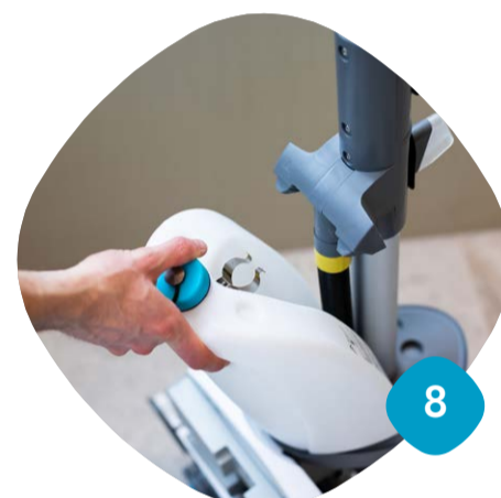
Ta loss revattentanken