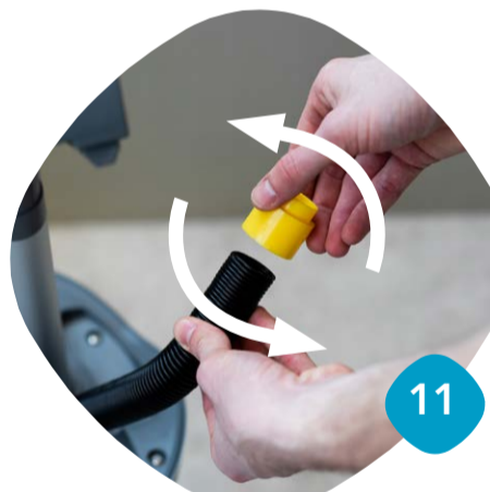
Gänga loss anslutningen