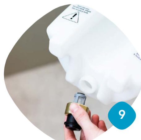
Gänga loss silen & rengör