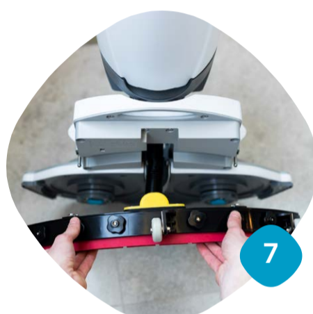
Ta loss sugskrapan & rengör