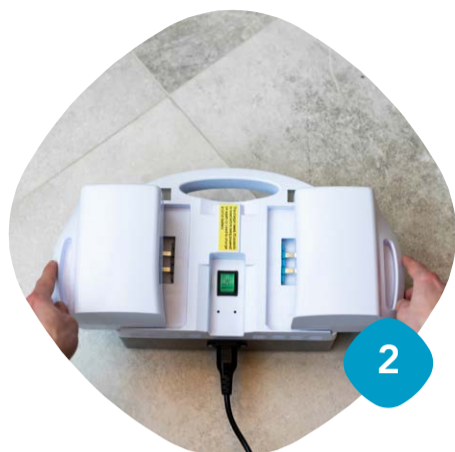
Sätt på laddning