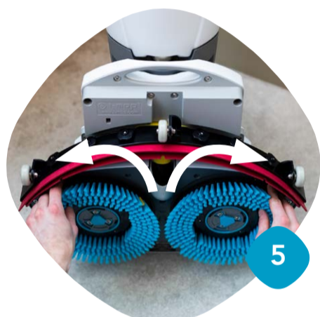
Ta loss borstarna & rengör