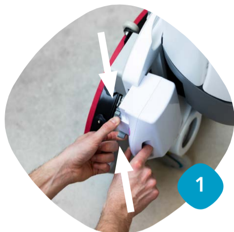
Ta loss batterierna

Så här enkelt rengör du din maskin för bästa städresultat.