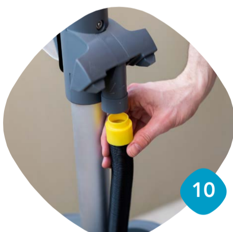
Ta loss sugslangen