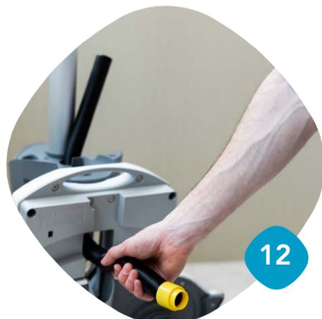
Dra ut sugslangen & skölj