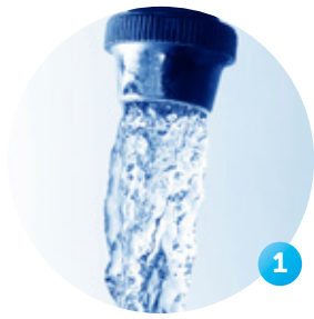
Anslut vanligt kranvatten till UltraH 2 O-filtret.